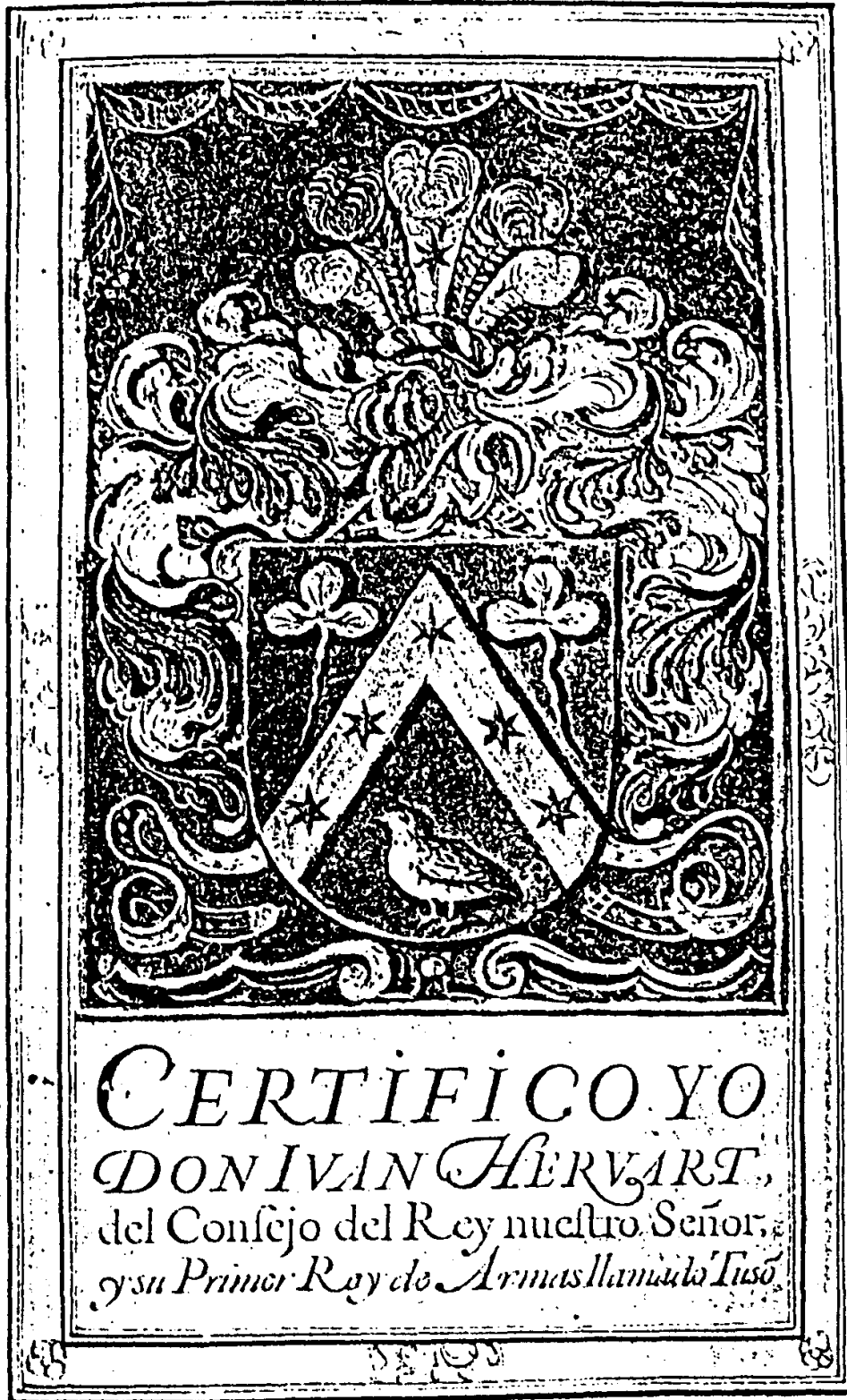
Escudo nobiliario de la familia Bécquer (Biblioteca Capituluar de Sevilla)